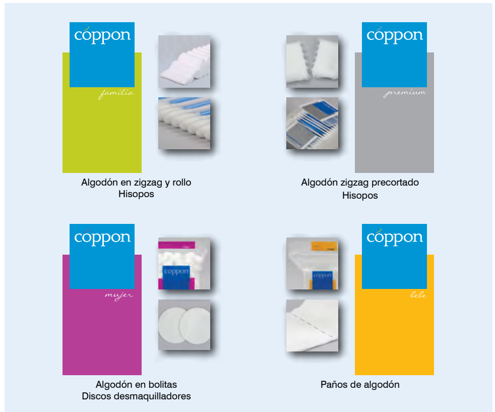
Algodón en zigzag y rollo Hisopos

Una línea Cópbon para cada tipo de necesidad